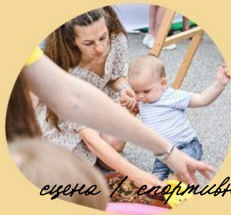
ежедневная / спортивная площадка